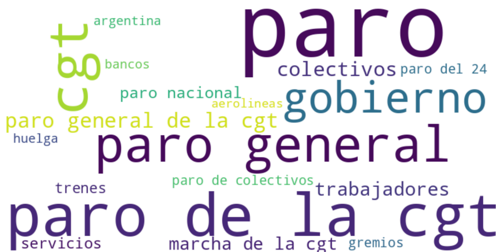
Figura 1. Nube de palabras de los sustantivos más utilizados en los titulares del corpus

Nota: esta nube de palabras muestra los 20 sustantivos más utilizados en los titulares del corpus analizado. Las palabras con mayor tamaño tienen una mayor frecuencia de aparición.