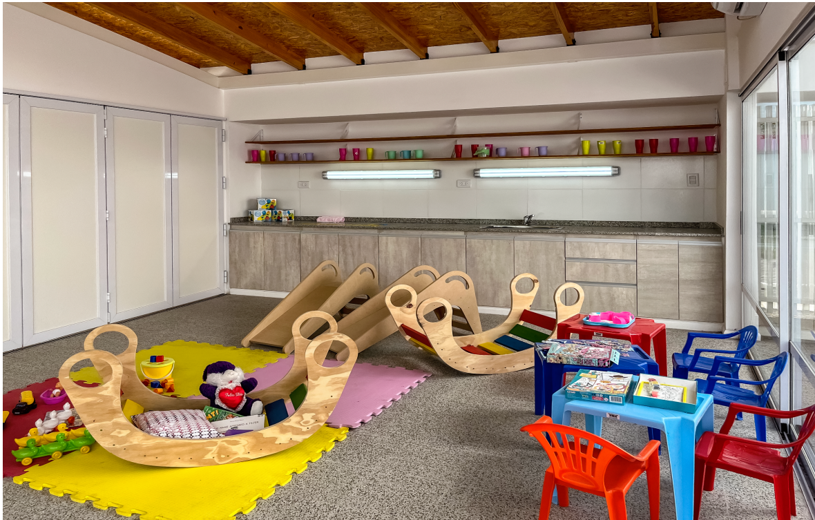
Centro de Desarrollo Infantil (CDI) ubicado en La Leonesa, Chaco.

Luego de indagar sobre experiencias regionales en materia de acciones concretas por parte del Estado que contribuyen a la reducción de desigualdades históricas, resulta interesante conocer el caso del Ministerio de Obras Públicas de Argentina, a partir del rol que asumió en el impulso de una política de construcción de Infraestructura del Cuidado con articulación federal, rendición de cuentas, participación ciudadana e inversión priorizada.