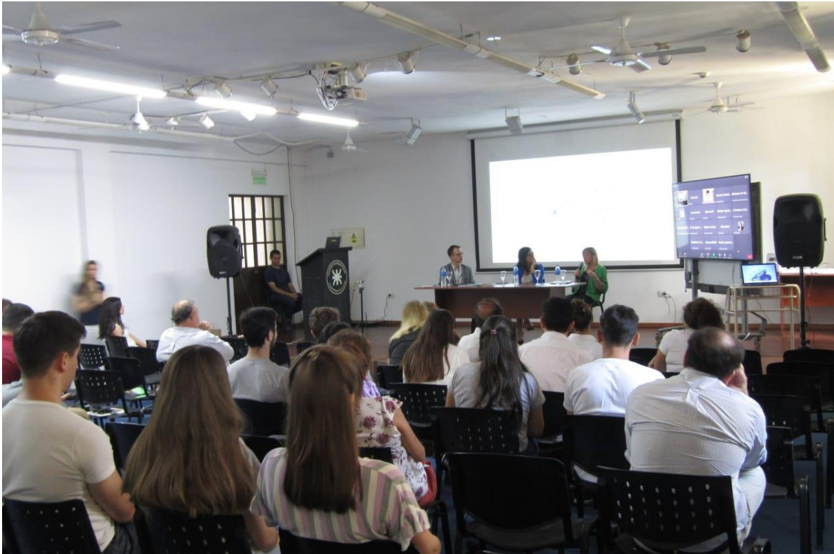
Jornadas Federales del Observatorio de la Obra Pública desarrolladas en Concordia, Entre Ríos

Es imposible pensar en un crecimiento de la economía sin antes detenerse a analizar la deuda que tienen los países de América Latina en relación a las políticas del cuidado. El Estado debe tomar como propias estas banderas y garantizar los derechos de las mujeres, las infancias, las diversidades, las personas mayores y las personas con discapacidad, sectores sobre los que más ha impactado el avance de modelos neoliberales y discursos reduccionistas.