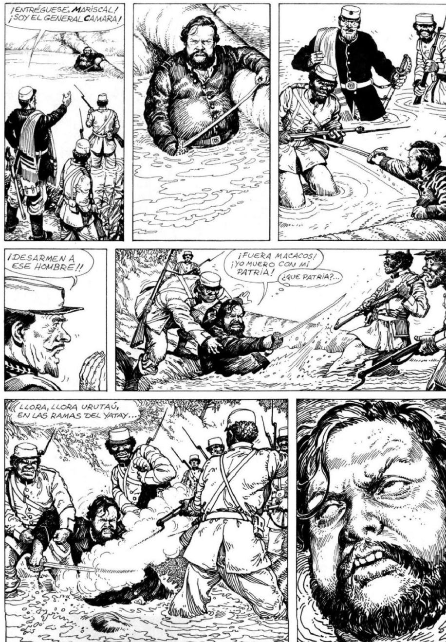
FIGURA 2 – 4 a página de “La Guerra del Paraguay” (Solano López/Solano López, 2010: 40). Nótese que al momento de definir las últimas palabras del Mariscal López (muero con mi patria/muero por mi patria) los artistas optan por “¡Fuera macacos! ¡Yo muero con mi patria!” seguida del amargo lamento “¿Qué patria?...”.

En el segundo tramo la historieta da un salto temporal hacia adelante, momento en que Aveiro –ya avejentado y cargando a costas el estigma de «traidor»– evoca y pone en palabras distintos episodios bélicos que lo marcaron de modo perenne: el ataque y aniquilación en Yatay de la columna del mayor Pedro Duarte (agosto de 1865, Campaña de Uruguayana ), la posterior captura y puesta en detención de los sobrevivientes paraguayos por parte de las