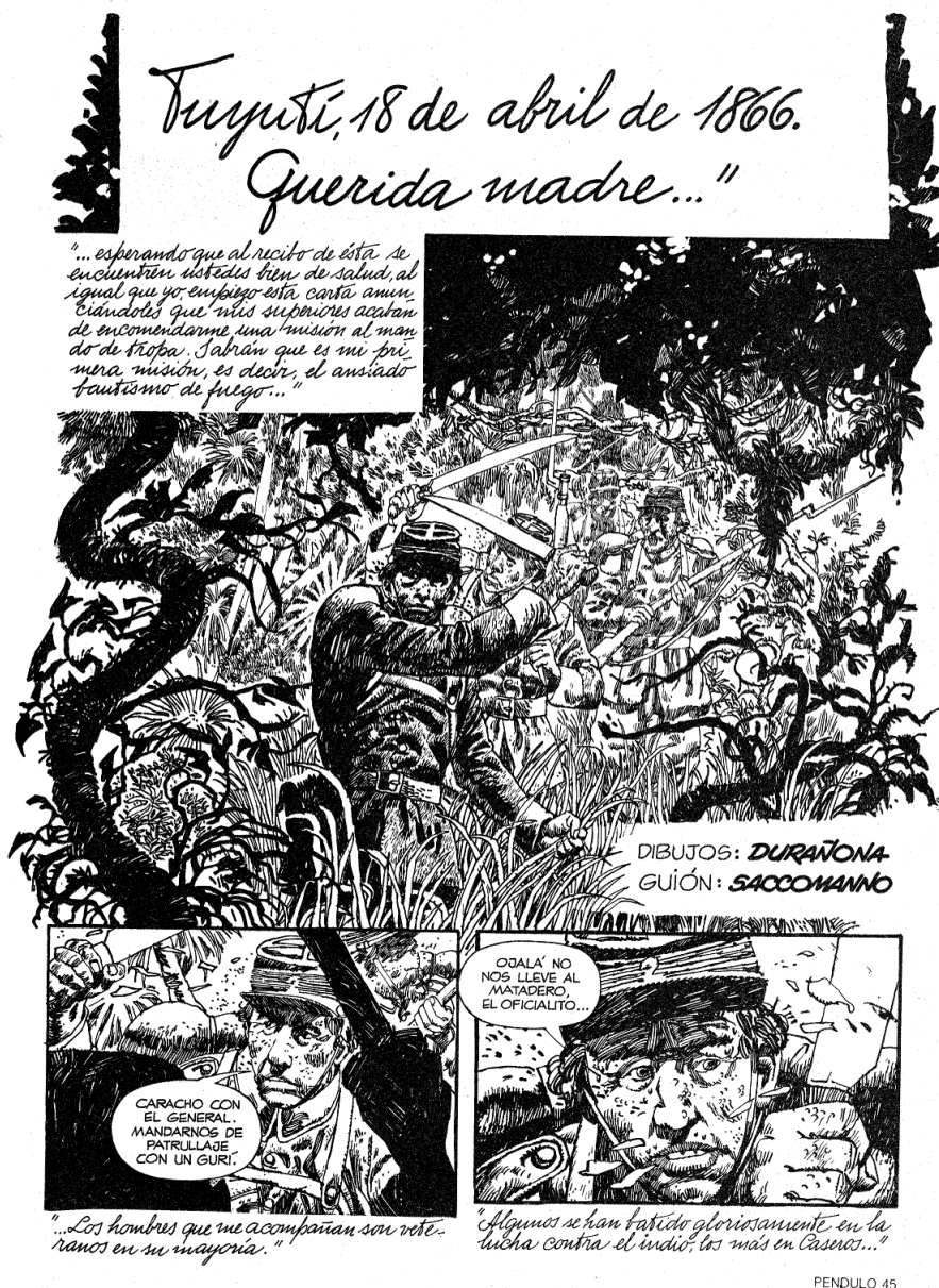
FIGURA 1 – 1ª página de "Tuyuti, 18 de abril de 1866. Querida Madre..." (Durañona/Saccomanno, 1979: 45)

En este caso particular, la historia del joven suboficial que, esperanzado, avanza por los pantanos 5 mientras en off se evocan las líneas escritas a su madre desde el frente de batalla despierta la empatía del lector, situación que se ve abruptamente interrumpida por la aparición de soldados paraguayos que no demuestran emoción alguna ni evocan para sí figuras fraternales, tan sólo abren fuego contra la pequeña tropa expedicionaria. Con su irrupción gráfica se constituyen en el contrapunto sorpresivo que completa el escenario bélico. Esto se