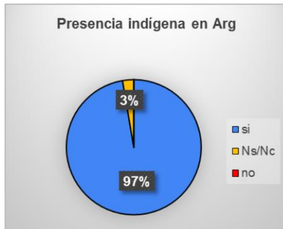
Gráfico 2: Presencia indígena en Argentina.