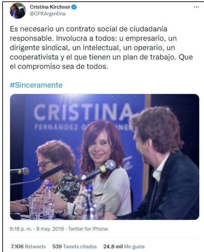
Imagen 5. Ejemplo de contrato social de ciudadanía responsable