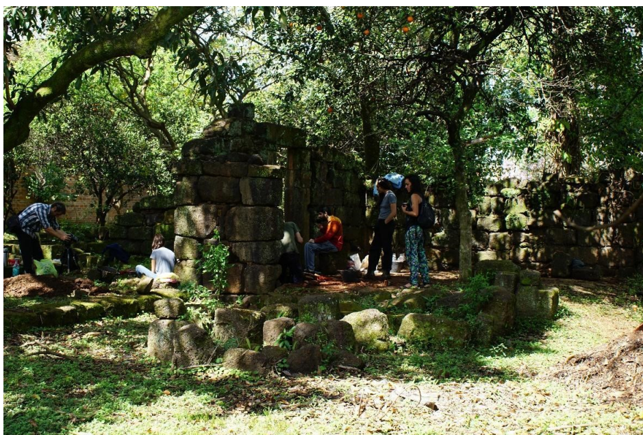
FIGURA 5. Equipo de investigación realizando trabajos de excavación en el sitio CONCEP 7