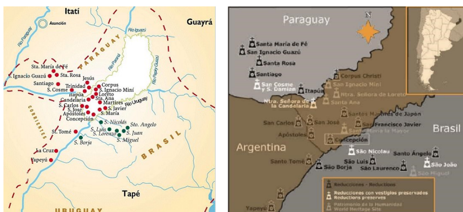
FIGURA 1. Mapa con la ubicación de los treinta pueblos definitivos

A principios del siglo XVIII, se crearon los treinta pueblos guaraní-jesuíticos, ubicados en los actuales territorios de Paraguay (ocho), Brasil (siete) y Argentina (quince). En este último, se concentraron en las provincias de Corrientes (cuatro) y Misiones (once) (Duarte, 2010), en donde se emplazaba la antigua reducción de Concepción, ubicada en el actual casco histórico del municipio de Concepción de la Sierra (Figura 1).