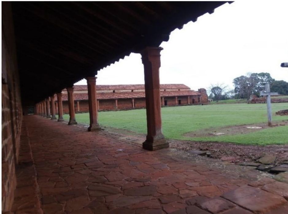
FIGURA 3. San Cosme y Damián. Vista de la galería y, al fondo, la residencia de los jesuitas. Actualmente es un espacio de uso cultural por parte de la comunidad local.