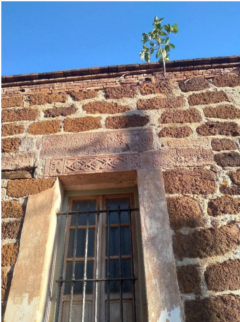
FIGURA 4. Casa de piedra ubicada frente a la plaza principal del pueblo. Se pueden observar sillares reutilizados y un dintel con decoración