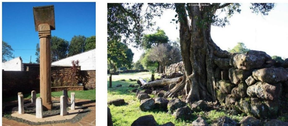
FIGURA 2. Muros de San Carlos

Ubicado también en la provincia de Corrientes se encuentra San Carlos, en el departamento de Ituzaingó; es un pueblo con vestigios históricos que manifiestan su pasado jesuítico-guaraní y escenario de una de las épicas batallas de las fuerzas misioneras comandadas por Andrés Guacurarí en el año 1818. El pueblo moderno de San Carlos creció sobre las ruinas de la antigua reducción y hoy pueden verse los viejos muros y cimientos centenarios mezclándose con las construcciones modernas (Figura 2). Un museo de sitio rescata importantes restos históricos, en gran parte recuperados en excavaciones arqueológicas que se realizaron en la década de 1970 (Snihur, 2017).