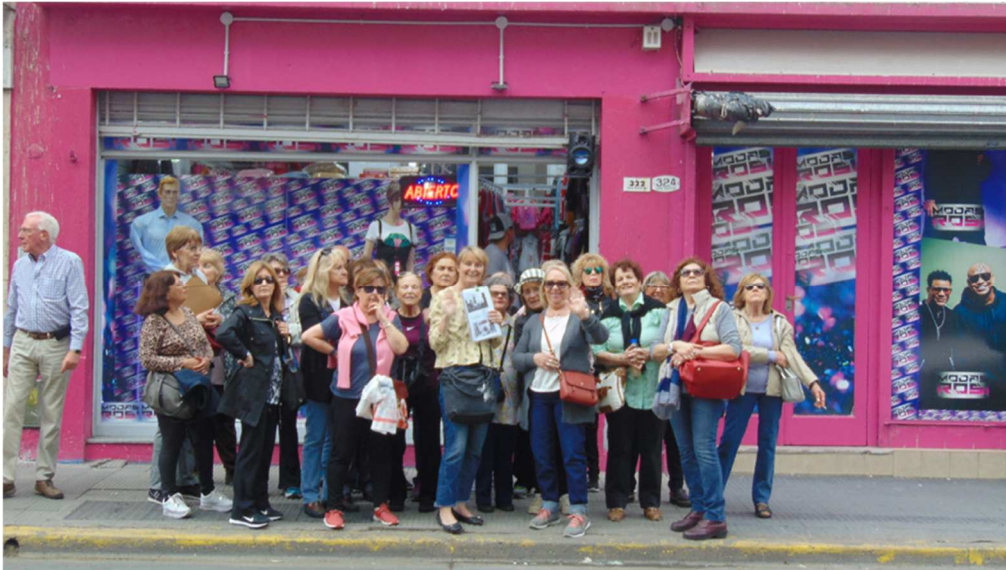
Imagen N°5. Grupo de alumnos y docentes del curso “Pasear y Detenerse”.