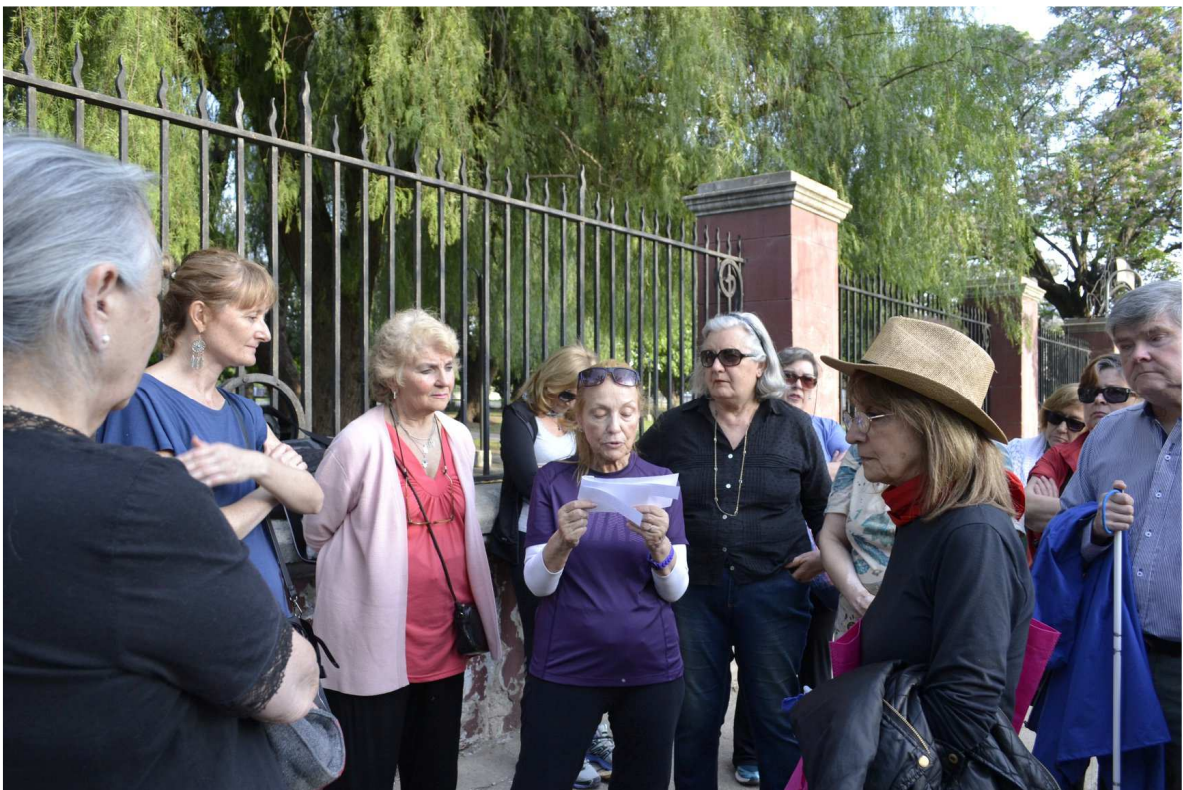
Imagen N°3. Lectura frente a la Estación Sur

Después de bastante andar –solo un caminador podía recorrer de un tirón tal distancia- se venía a Chiclana y a O’Higgins como a un oasis de luces. Las luces presumían el fasto de las grandes capitales. Cada peatón recibía un cintarazo de lujo. Ágata descubría cada vez nuevos carteles, anuncios, propagandas (...) Ágata conoció sola los barrios de la estación, adonde se veían llegar y partir en torno al viejo bebedero de caballos a los trabajadores de la zona (Mallea, 1961: 1057).