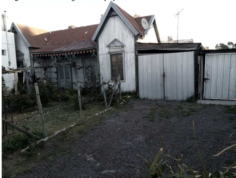
Imagen N°4. Casa antigua de chapa y madera

En el caso de la visita a Ingeniero White, la caminata abarcó la antigua área comercial, donde aún se encuentran construcciones de la etapa de esplendor del puerto, antes de la creación del polo petroquímico. Allí es posible apreciar construcciones típicas de madera y chapa, relacionadas con la etapa de creación del puerto, y que aparecen descritas como viviendas tradicionales en la novela de Mallea. Esas viviendas en la actualidad se mantienen en malas condiciones de preservación y contrastan con construcciones más modernas (imagen N°4). No obstante, la vivienda mejor conservada es la que contiene al Museo del Puerto y donde funcionó la primera aduana.