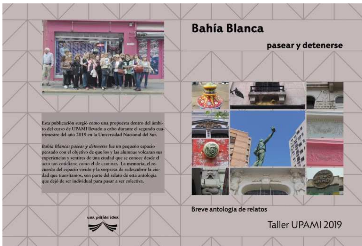
Imagen N°1. Portada y contratapa de la publicación resultante del curso.

publicación resume una breve síntesis sobre el re-descubrimiento de la ciudad por parte de un grupo de adultos mayores bahienses.