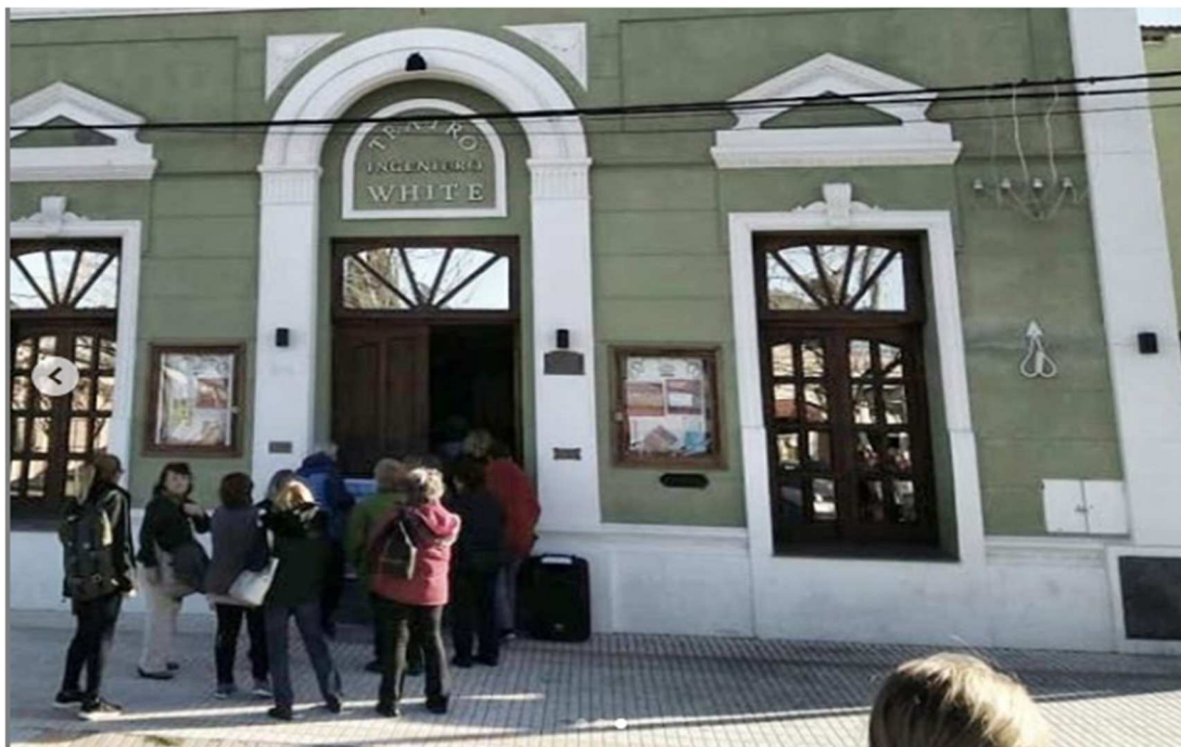
Imagen N°7. Visita al Teatro de Ingenio White como parte de recorrido para contextualizar los primeros capítulos de la novela “Todo verdor perecerá” de Eduardo Mallea.