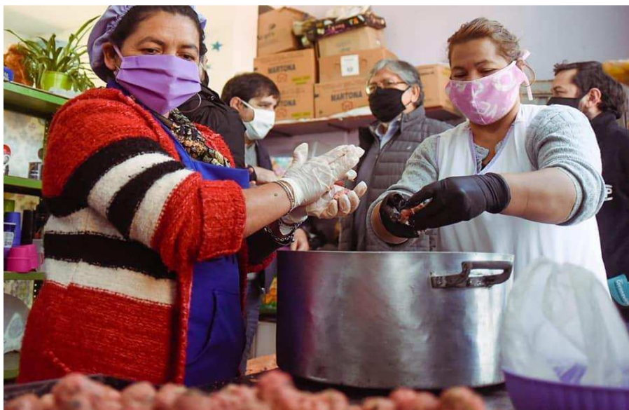
Foto 1. Comedor comunitario, Costa Esperanza.

Fuente: Comedor Vivan los Sueños Felices (Facebook, 15/05/2020).