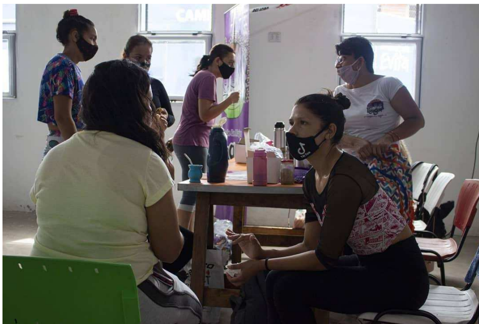
Fuente: Asociación Casa de la Mujer Kuña Guapa (Facebook, 29/01/2021).

Aunque estos barrios están segregados por fronteras materiales y simbólicas que tienden a aislarlos del resto de la ciudad, ellas encontraron el modo de trascenderlas a través de la territorialidad de prácticas que implican diversas movilidades dentro y fuera del espacio barrial para mitigar la exclusión (Segura, 2006).