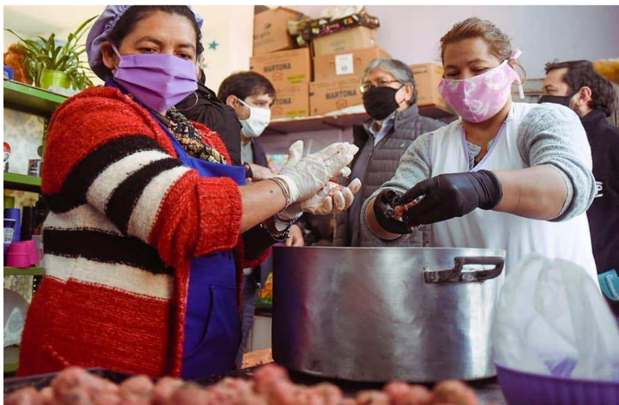
Foto 1. Comedor comunitario, Costa Esperanza.

Fuente: Comedor Vivan los Sueños Felices (Facebook, 15/05/2020).