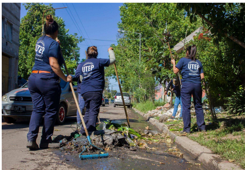
Foto 2. Cooperativa de limpieza y mantenimiento barrial, La Carcova.