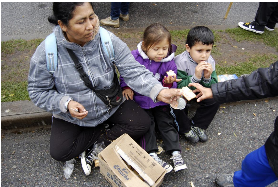
Movilización frente al Ministerio de Desarrollo social. 15 de marzo de 2010.

La mayor parte de los hechos producidos durante estos casi ocho meses de manifestación contienen una sola acción con una duración clásica (aprox. 2 horas). Entre los formatos más usados se encuentran, como en otros momentos de la lucha de estas organizaciones, las movilizaciones y los cortes de vías públicas. No obstante la relevancia cualitativa que tuvieron los hechos múltiples y los de larga duración hacen que los reseñemos especialmente.