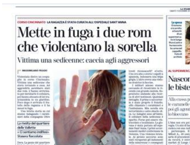
Fig. 1. El artículo.

cuales la convocación de una manifestación contra la violencia. Tras la apariencia oficial de una manifestación pacífica, circuló sin embargo por el barrio un panfleto con un claro mensaje.