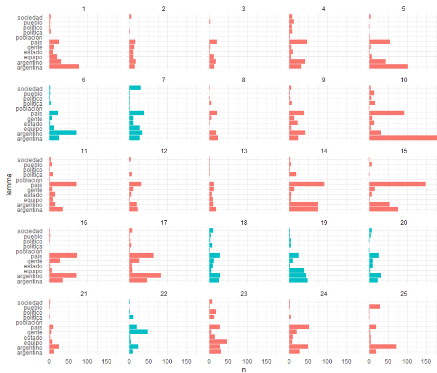
GRÁFICO 2 Incidencia de ciertas palabras en oraciones representativas de cada tópico