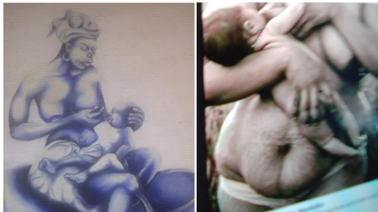
Figura 6. Los cuidados y la maternidad como elementos clave

Es dar vida, cuidar, escucha, paciencia infinita, capacidad de organización, encarnar la belleza, energía de vida, humanidad, transmisora, protectora, luchadora, poder hacer varias cosas a la vez, ayudar a crecer (...) Es importante ayudar a mi familia aquí y allí. (Narrativa 29).