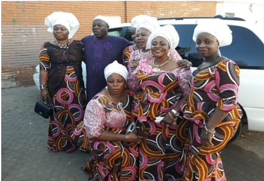
Figura 2. Espacios religiosos como forma de unión y ayuda

Yo participo en la asociación Lutfil-lahi Sevilla Andalucía es donde reunimos cada domingo todos los Nigero/as que somos musulmanes y allí llevamos todos nuestro hijo/a para aprender de que va nuestra religión. (Narrativa 7).