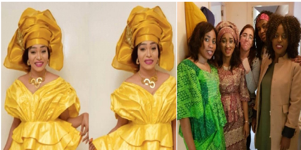
Figura 1. La Tontina como forma de apoyo y preservación cultural

Los senegaleses, somos gente que estamos muy unida aquí (...) tenemos una asociación grande, cada uno aporta dinero y, por ejemplo, si alguien fallece pues pagamos que se pueda enviar el cuerpo a mi país, en esto yo también participo. (Narrativa 2).