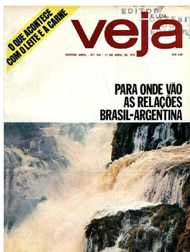
Veja , N° 240, 11/4/1973

En este momento, las relaciones entre Brasil y Argentina, para Veja , se subsumen al conflicto por la inminente construcción de Itaipú. Otras divergencias en torno a cuestiones comerciales, que la embajada argentina en Brasil destacó, no son tenidas en cuenta por la revista. En marzo de 1973, pocos meses antes de la firma del Tratado de Itaipú, entre Brasil y Paraguay, Veja hace notar las pérdidas que implicaría para su país ceder ante las presiones argentinas por meras intenciones de construcción de otras usinas, especialmente, en esta nota Corpus que, finalmente fue un proyecto que no se concretó.