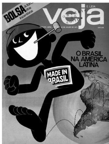
Veja , N° 151, 28/7/1971

En esta portada el Sací aparece saliendo de Brasil y recorriendo, a saltos o remolinos, el cono sur. Con su cara pícaro, maliciosa, el Sací representa (irónicamente según Veja ) el lugar que ocupa Brasil en América Latina para sus vecinos. Un muchacho malvado pero que con sus poderes puede ayudar a sus vecinos más débiles.