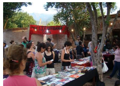
Ilustración 1: feria popular del libro, Córdoba, Argentina

Tanto las producciones artesanales mexicanas, como las ferias de libros populares y los saberes de las “abuelas curanderas” de los barrios de Córdoba (Argentina), guardan relación con estrategias de reivindicación de saberes ancestrales y con la necesidad de obtener recursos económicos, en el marco de sociedades industrializadas que empobrecen vidas y tornan otras como exóticas, reduciendo la vida de pueblos enteros a la