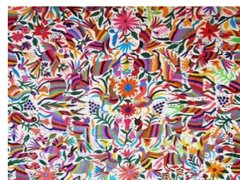
Ilustración 8: Tenango artesanal