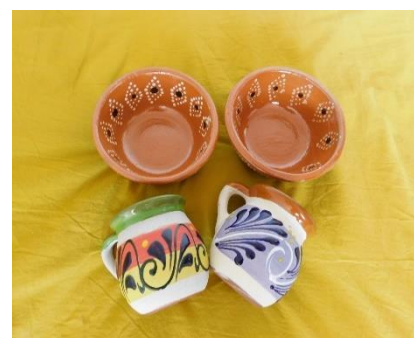
Ilustración 3: piezas de alfarería de talleres familiares de Puebla, México

Partimos de la premisa de que lo que se considera arte, ha sido mayormente cooptado por las definiciones del mundo moderno/colonial capitalista. Por tanto, el arte mercantilizado, el que circula por los espacios de reconocimiento, no podría ser considerado una manera de resistencia, ni una estética y captura de lo bello por encima de la lógica de la utilidad y la productividad (Cfr. Torres, 2017). Encontramos que lejos de interrogar críticamente la realidad, el arte mercantilista suele limitar cualquier esfuerzo de re-existencia, debido a sus cánones y a los formatos que impone si él o la artista quieren ser parte o incluirse en el universo del arte legítimo y vendible.