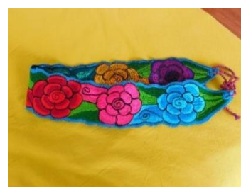
Ilustración 7: Faja bordada por mujeres de Oaxaca, México