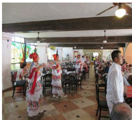
Ilustración 2: mujeres y varones danzan vestidos con ropa típicas de la cultura maya en México

El desarrollo capitalista en su fase globalizadora y de la mano del conocimiento hegemónico, expolia territorios de Nuestra América usufructuando la naturaleza y explotando la mano de obra local. Esto es observable en la península de Yucatán México, donde la costa del mar se encuentra privatizada en manos de hoteles cuyos dueños son empresarios europeos y norteamericanos, que emplean mano de obra principalmente mexicana mestiza o mujeres indígenas, quienes deben ir vestidas obligatoriamente con ropajes “tradicionales”, tal como se observa en la fotografía n.º1. La cultura de los pueblos mayas y aztecas se vuelve un atuendo o una artesanía comercializada por los empresarios extranjeros y para el turismo. Los mexicanos mestizos se ocupan de atender al turismo en restaurantes, cabañas, etc. siempre hablando en inglés (Notas de campo, 2017: pág. 3).