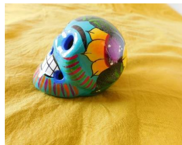
Ilustración 4: Pieza de barro pintada con esmalte, vendida en un mercado de Coyoacán, México

Por el contrario, el arte popular, como vemos en la foto n°3 y 4, aun preserva algunas apropiaciones comunitarias a través de sus rituales, cuentos, poesías, relatos orales y piezas de arte. Lo que colonialmente se considera artesanía, son materializaciones culturales de quienes ocupan los sectores sociales de menores recursos y reconocimiento social.