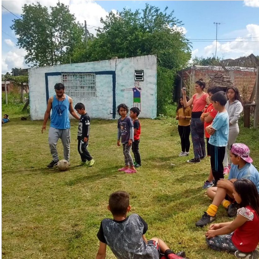
Figura 1: fotografía del Taller de Fútbol, 2018.

Normalmente, los talleres del Merendero de una misma temática solían durar uno o dos meses. Sin embargo, el Taller de Fútbol se extendió mucho más allá de ese plazo, y pasó a tener una gran centralidad en la organización de toda la jornada. Su inusitada extensión en el tiempo no fue la única novedad que impulsó este Taller. La diversidad de edades que participaban lo diferenciaba de los otros talleres, que se hallaban mucho más segmentados, sobre todo cuando involucraban prácticas de lectura y escritura, algo que resulta habitual de hecho en espacios lúdicos y recreativos para niñeces (Duek & Enriz, 2011). Por el contrario, en el Taller de Fútbol, participaban niñxs de entre 7 y 18 años, lo que conformaba uno de los grandes desafíos a sortear. Lxs adolescentes (y sobre todo los varones), “jugaban fuerte”, por lo que la presencia de niñxs más pequeñxs requería de un mayor control de la fuerza y una cierta disposición generosa a acompañar a lxs más jóvenes en su entrenamiento. Esta muestra de “paciencia” no siempre fue exitosa, dado que los adolescentes sentían que tenían que “resignar” su talento y su capacidad para que lxs más jóvenes pudieran participar. Es decir, estaban reproduciendo lo mismo que sentían como excluyente en la cancha de potrero del barrio, cuando jugadores mayores los dejaban de lado.