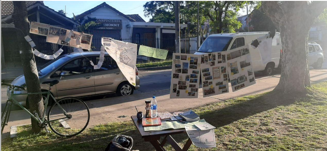
Figura 10: Exposición del Taller Misterioso de Adolescentes en la edición 2023 de la MOCCA, Claypole.

En esta muestra se recuperó el trabajo de todo el año del Taller de Adolescentes (solapado con el de Fútbol), que incluyó también varias publicaciones online , la generación de una trivía (digital pero también en papel) sobre datos del distrito y la confección de volantes para repartir el día del evento en Claypole.