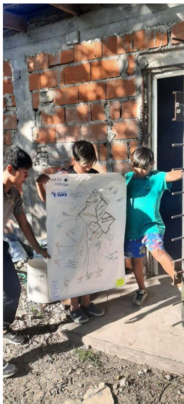
Figura 9: Confección final del mapa futbolero en el Taller, 2023.

En esta dirección de “tematizar” la práctica de fútbol, durante el año 2023 se realizó una actividad de mapeo de los espacios barriales del partido de Almirante Brown en los que se jugara ese deporte. A partir del trabajo con el libro editado por el municipio Brown. Una historia compartida (Pigna et al., 2022), que recoge testimonios de vecinxs “históricxs” de la zona (todos adultxs, no hay palabras de niñxs), se fue trazando un recorrido de antiguos clubes y sociedades de fomento, algunas de los cuales aún existen, para generar un mapa (tanto en papel como en su versión digital) de estos espacios. Lxs adolescentes iban añadiendo nombres de equipos que conocían por haber jugado allí o haber rivalizado en alguna competencia contra ellos, y así se le dio forma a la exposición itinerante llamada “El arte del potrero”, que fue presentada en la Muestra de Organizaciones Comunitarias y Culturales Autogestionadas (MOCCA) 12 en Claypole (PBA) a fines del 2023.