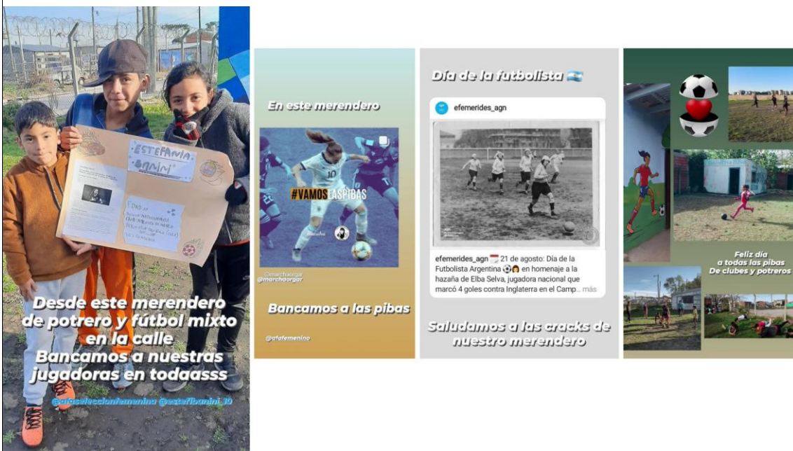
Figura 8: producciones del Taller vinculadas a la práctica de fútbol femenino, 2023.

Este segundo Taller, si bien tiene agenda propia y otra educadora al frente, recupera diversas reflexiones que nacen del Taller de Fútbol, así como conocimientos de la práctica deportiva que lxs adolescentes fueron construyendo en todos los espacios donde se ejercitan. De este modo, se realizan videos explicativos de jugadas posibles, o se explican las distintas modalidades existentes de torneos y estilos de juego. Un punto importante radicó en el conocimiento de las jugadoras argentinas de fútbol, dado que si bien las niñas y adolescentes del barrio cada vez juegan en más espacios, el visionado de las selecciones y ligas femeninas es prácticamente inexistente. Antes del taller, solamente una de las niñas podía nombrar a una jugadora del seleccionado (precisamente, quien juega en el conjunto infantil femenino de Banfield).