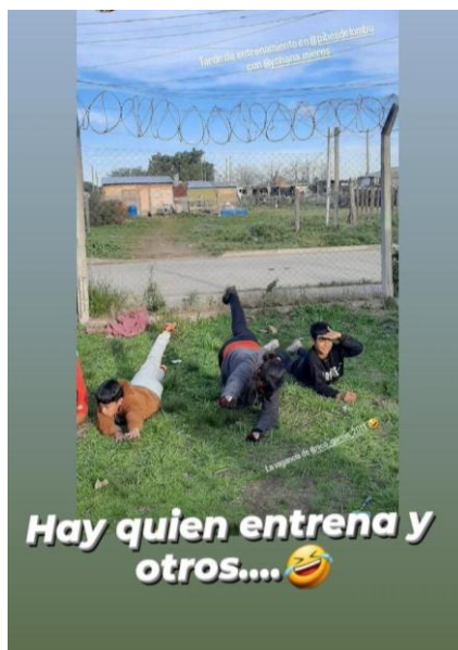
Figura 2: el señalamiento de que a veces cuesta realizar los ejercicios de entrenamiento es usual entre lxs miembros del Merendero.

ordenado donde aprenden cosas, dado que jugar pueden hacerlo en otros lados, pero tener alguien que oficie de técnico no necesariamente les ocurre a todxs. 4