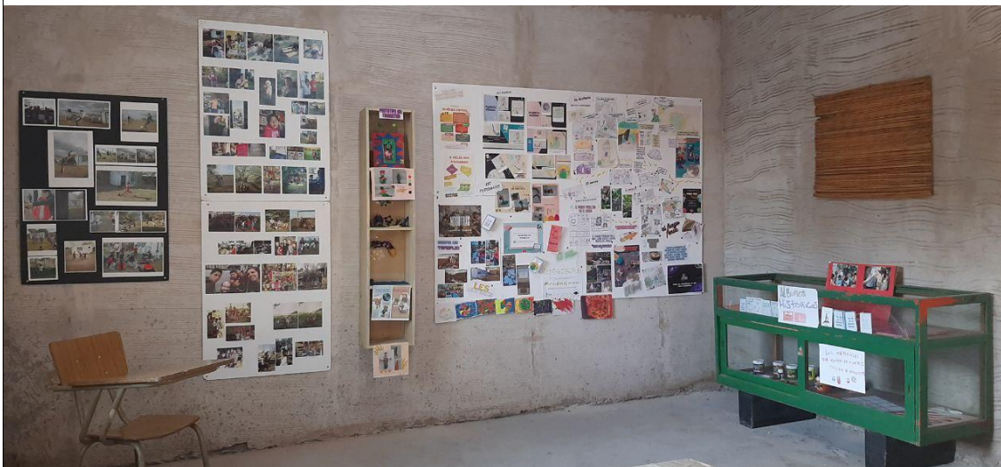
Figura 4: espacio de exposición del Merendero. El panel negro de la izquierda responde a la práctica futbolística, 2022.

La presencia del Taller de fútbol marcó de distintos modos la identidad del Merendero. Por ejemplo, tuvo un lugar central en la primera muestra fotográfica realizada en 2019 en dos centros culturales de la Ciudad de Buenos Aires, y que hoy forma parte del espacio de exposición propio con el que el Merendero cuenta desde 2022 (Figura 4). También aparece de manera significativa en las publicaciones diarias en las redes sociales del espacio en la que participan niñxs y adultxs 7 , así como en las personales de lxs adolescentes que cuentan con sus propios perfiles y suelen compartir las imágenes de ellxs practicando deporte dentro del Merendero.