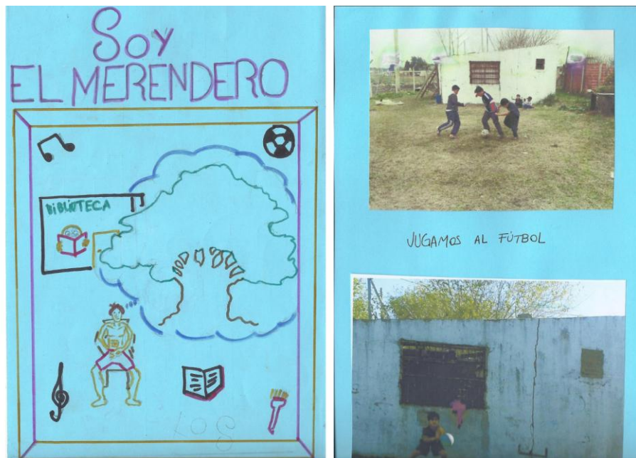
Figura 3: libro Soy el Merendero (2019). Portada y página interna donde se ve a los niños jugando al fútbol.

Este ordenamiento implica, de acuerdo a lxs chicxs, más “exigencia” física y mayor precisión en la técnica, pero también abrirle el juego a otros actores que en los clubes o en la cancha de barrio no tenían lugar, como vimos con el caso de las chicas. En aquella entrevista de 2019, los adolescentes varones remarcaron que al principio les costó asimilar la idea de un fútbol mixto, aunque con el correr del tiempo y del Taller se fue volviendo una práctica cotidiana y hasta deseada: “cuando entraban las chicas, yo iba re fuerte a propósito, porque no quería...pero ahora estoy esperando que lleguen”, “yo quiero jugar con B. porque ella ataja re bien”, “a un mismo nivel de entrenamiento, jugamos todos igual”.