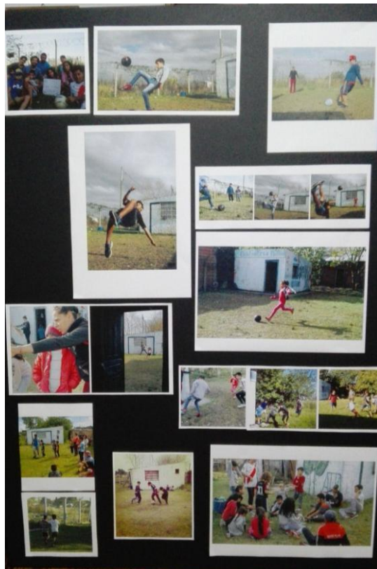
Figura 5: panel sobre la práctica de fútbol de la primera muestra fotográfica del Merendero, 2019.

Para las muestras iniciales se recuperaron alrededor de 300 imágenes, compuestas por las fotografías realizadas a lo largo de los años de funcionamiento de la organización almacenadas sobre todo en su perfil de Facebook; así como por algunas específicas realizadas para la ocasión. 8 Se montaron siete paneles de fotografías, textos y una serie de dibujos realizados por lxs niñxs y adolescentes en sus talleres, dando lugar a una muestra itinerante presentada posteriormente en distintos espacios, incluyendo experiencias digitales. 9 De los tres paneles que al momento de escritura se encuentran exhibidos en el Merendero, uno se dedica exclusivamente a la práctica de fútbol (Figura 5).