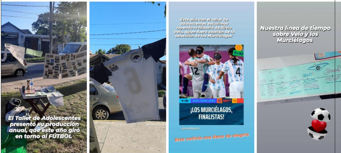
Figuras 11 y 12: material producido por el Taller Misterioso de Adolescentes para la muestra “El arte del potrero”, 2023.

En el folleto que se repartió (Figura 13), el grupo de adolescentes del Taller escribió las siguientes palabras: