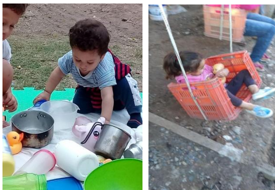
Fotos tomadas por las familias de niños y niñas jugando en sus casas

Las fotografías recopiladas constituyen registros muy valiosos, ya que las mismas permiten conocer y analizar algunos de los juegos que tuvieron y tienen lugar en el ámbito doméstico, los materiales lúdicos y juguetes con los que juegan los niños y niñas, así como también la disposición de los espacios y disponibilidad de los/as adultos/as.