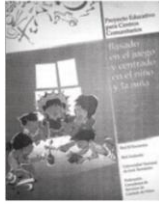
Imagen del cuadernillo "Abriendo el Juego" (RED ANDANDO, 2016:10)

E xploran los elementos de juego. Experimentan. Deducen cosas por sí mismos. Les fomenta la creatividad y su capacidad para resolver problemas. A través del juego se puede empezar a conocer las letras, las palabras y los números, las poesías, las canciones. Desarrollan fuerza y coordinación. Expresan sus emociones de manera positiva y les permite expresar sus sentimientos. Actúan y asumen diferentes roles, aprenden la igualdad en la diversidad. Pero además, mediante el juego aprenden a relacionarse con los demás y a sentirse bien con ellos/as mismos. Aprenden a respetar turnos, a compartir, a colaborar. Desarrollan lazos de amistad con otros. Adquieren un mayor respeto hacia su persona y aprenden a tratar a los demás con respeto.