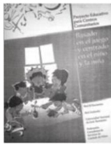
Imagen del cuadernillo "Abriendo el Juego" (RED ANDANDO, 2016:10)

E xploran los elementos de juego. Experimentan. Deducen cosas por sí mismos. Les fomenta la creatividad y su capacidad para resolver problemas. A través del juego se puede empezar a conocer las letras, las palabras y los números, las poesías, las canciones. Desarrollan fuerza y coordinación. Expresan sus emociones de manera positiva y les permite expresar sus sentimientos. Actúan y asumen diferentes roles, aprenden la igualdad en la diversidad. Pero además, mediante el juego aprenden a relacionarse con los demás y a sentirse bien con ellos/as mismos. Aprenden a respetar turnos, a compartir, a colaborar. Desarrollan lazos de amistad con otros. Adquieren un mayor respeto hacia su persona y aprenden a tratar a los demás con respeto.