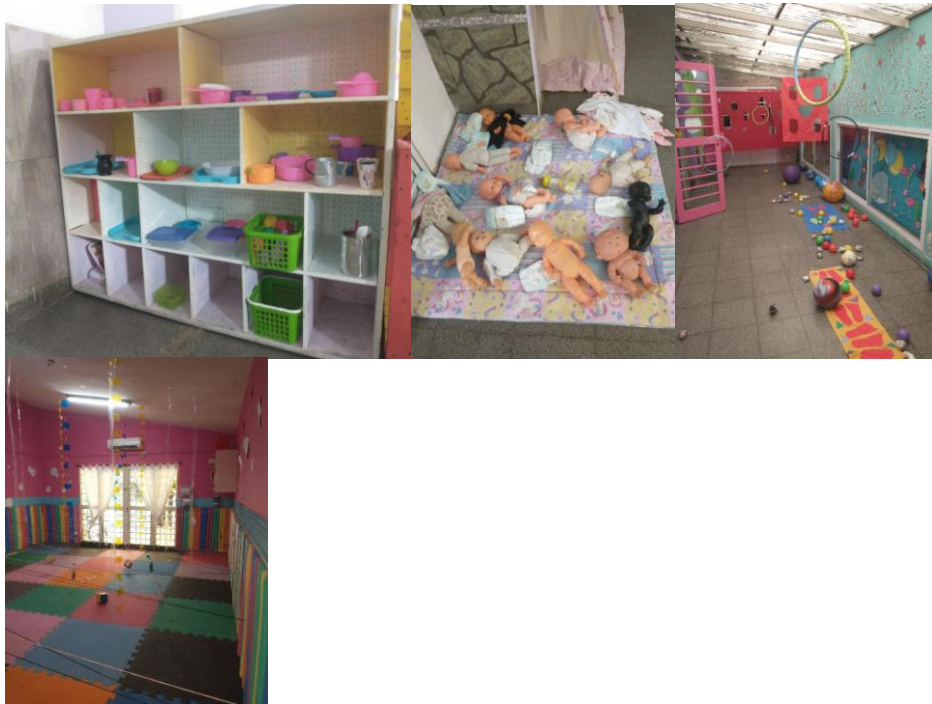
Registro fotográfico de espacios del Centro CF ambientado para la fiesta de fin de año (21/12/2021)

Los registros durante las observaciones participantes en los centros comunitarios y en los grupos de Facebook, dan cuenta de una gran diversidad de juegos en la vida cotidiana: