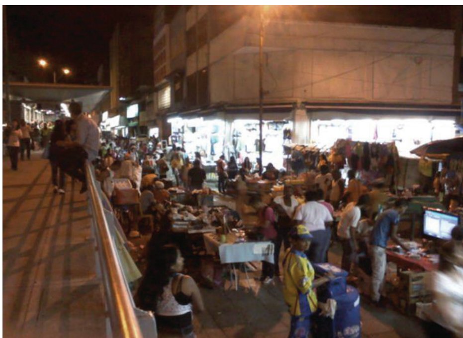
Foto: Adriam Gómez Bastidas y Paulo Andres Castillo Pascu , 2011.

Quienes van acompañados de sus hijos, en especial los fines de semana, pasan la jornada laboral entre la atención al cliente y el cuidado de éstos. En algunas ocasiones, otros vendedores ayudan con el cuidado de los niños. Algunos vendedores ambulantes reciben visitas esporádicas de amigos, conyugues o hijos mayores. Cabe mencionar que es común que varios miembros de la misma familia se encuentren trabajando como vendedores ambulantes.