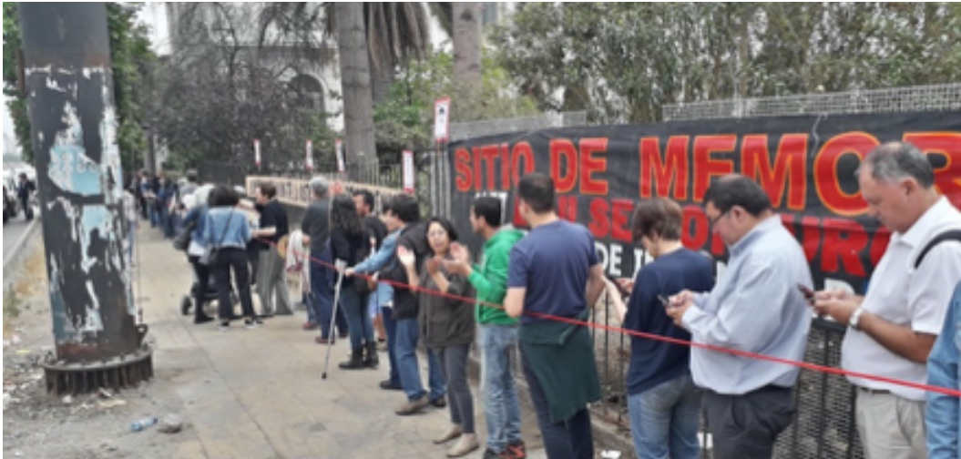
Figura V. “Mil manos para Borgoño”, protesta que rodeó el edificio de personas.