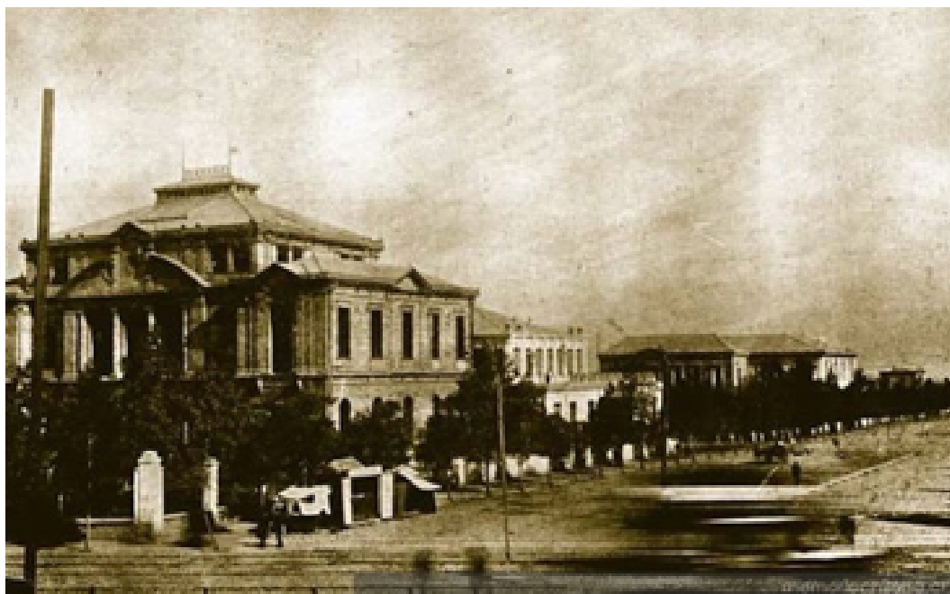
Figura II. Vista panorámica del Instituto de Higiene

La historia larga del ex cuartel siempre se ligó a la institucionalidad pública. Los orígenes de la construcción corresponden a un complejo sanitario de envergadura, que fue una expresión modernizadora, parte de la Comisión de Higiene Pública (1891) y del Instituto de Higiene (1892) 50 (Figura II). Las obras comenzaron en 1896, con el primero de los edificios y, en 1909 con los restantes, comprendiendo un total de cinco volúmenes: el pabellón de Higiene y Demografía, en la calle Independencia; el de Química; el de Microscopía y Bacteriología; el de Seroterapia, y, el Desinfectorio, ubicados en la calle Borgoño.