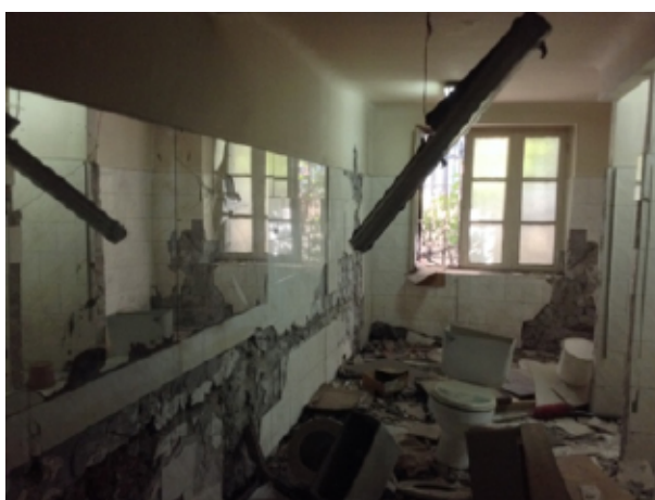
Figura VI. Vista interior de edificio principal del ex Instituto de Higiene (Independencia 56).