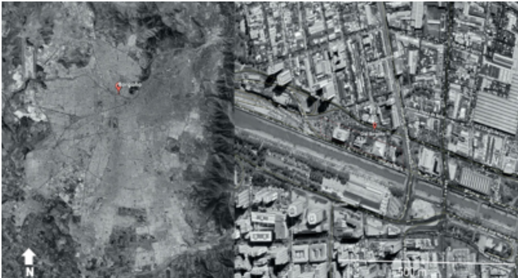
Figura I. Imágenes satelitales del ex Cuartel Borgoño. Ubicación respecto a Santiago de Chile (izquierda) y en relación a las calles (derecha).