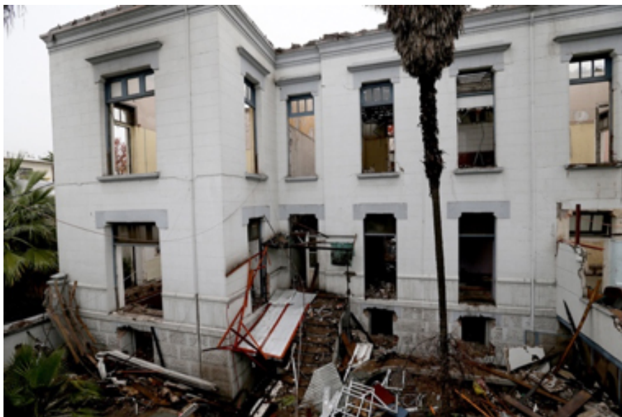
Figura IV. Vista de fachada de ex Pabellón de Microscopía (Borgño 1154).