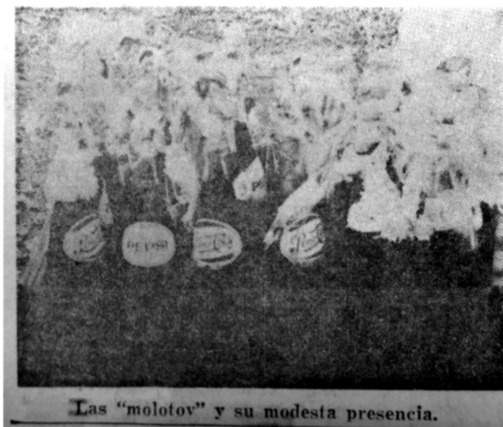
Imagen II. Molotovs armadas por los obreros en botellas de gaseosa y a simple vista de los espectadores y periodistas. La Voz del Interior , 14-5-1970.