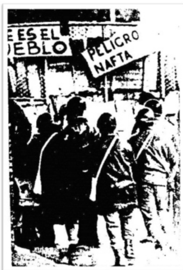
Imagen III. Operativo policial rodeando Perdiel. Los carteles escritos por los obreros apuntan a disuadir la represión. Revista Jerónimo , Córdoba, 2da quincena enero 1971.

Al día siguiente, el 3 de junio, los obreros de Fiat Concord, Fiat Materfer y Perkins se sumaron ocupando sus establecimientos en solidaridad y por sus propias reivindicaciones. La ola de ocupaciones reavivaba los fantasmas de una insurrección obrera. El Centro Comercial e Industrial de Córdoba expresaba en un comunicado que “la toma de establecimientos fabriles, la inmovilización de personas en calidad de rehenes y las graves amenazas que pesan sobre vidas y patrimonios constituyen intolerables violencias” 27 y el Secretario de Trabajo, Rubens San Sebastián, declaró que las