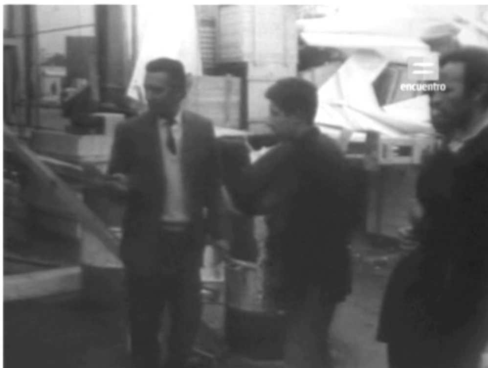
Imagen I. Entrevista televisiva a obreros de Perdriel mostrando el operativo de tanques de nafta. Del video documental Elpidio Torres y el SMATA Córdoba , Crónicas de Archivo, Canal Encuentro.

supuesto aquí nadie fuma, no?” pregunta el cronista. Mientras la cámara muestra los tanques y un surtidor de nafta, el periodista concluye: “Esta planta prácticamente puede volar en cualquier momento, y no exageramos absolutamente nada” 12 .