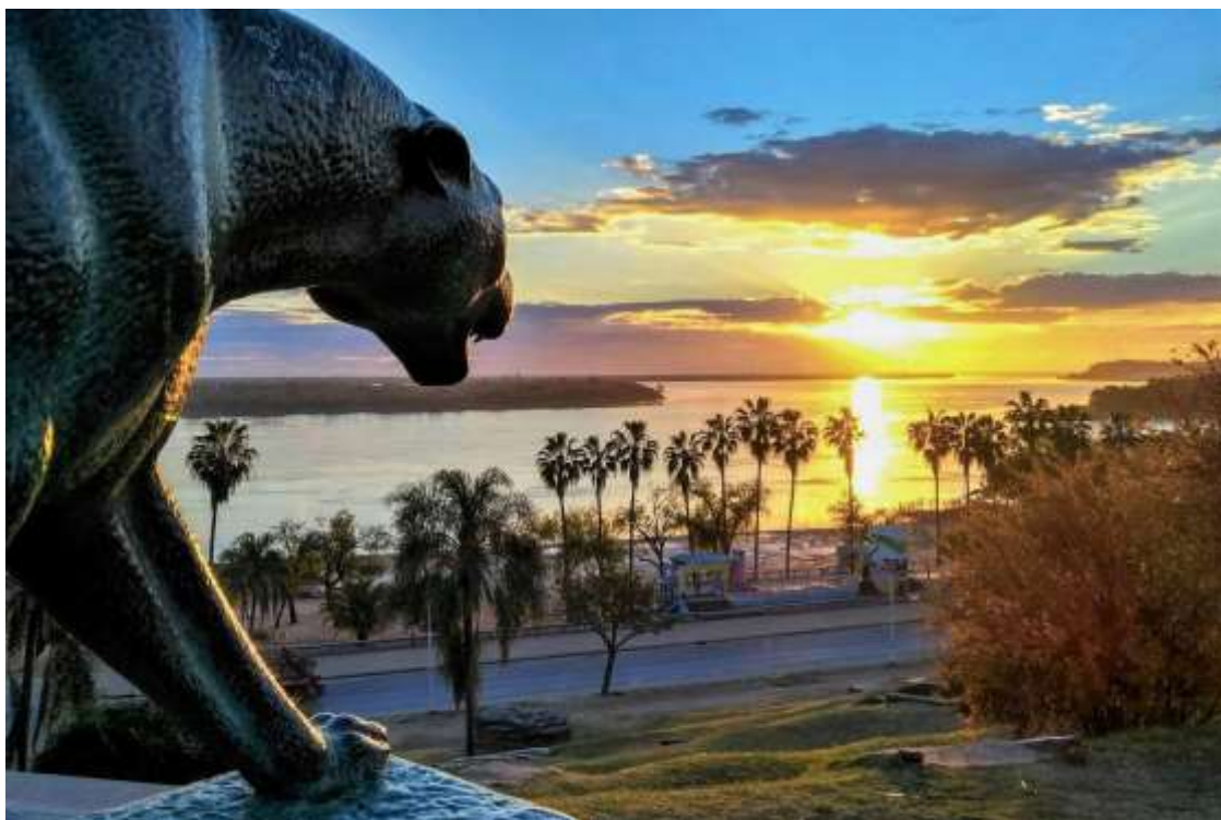
Figura N° 1. Amanecer desde El Yaguareté, obra de Emilio Sarniguet (costanera media)