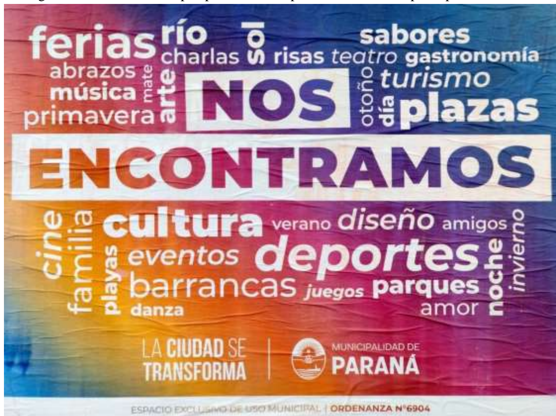
Figura N° 3. Síntesis de la perspectiva municipal en carteles del espacio público urbano.

La mayoría de estos espacios, incluidas las plazas de algunas vecinales del Gran Paraná, han sido creados, remodelados y/o articulados en la trama urbana por políticas municipales recientes que marcaron un punto de inflexión en la última década. Desde 2021, el municipio ejecuta un plan integral de recuperación y puesta en valor del espacio público, de la trama vial y del patrimonio histórico como eje central de políticas de modernización de la ciudad, cuyo horizonte es un perfil productivo a través del desarrollo del turismo y de los servicios asociados, del parque industrial y del conocimiento aplicado a la innovación tecnológica. 10 La matriz cultural que justifica e impulsa a estas políticas enfatiza ideas de transformación, de reactivación y de crecimiento que le imprimen movimiento a la ciudad; con espacios públicos urbanos para el encuentro, la socialización, el disfrute, en un marco de seguridad y de convivencia urbana. Es decir, se trata de una matriz biopolítica que estimula un estilo de vida activo en sinergia con un imaginario de ciudad saludable y sustentable. 11