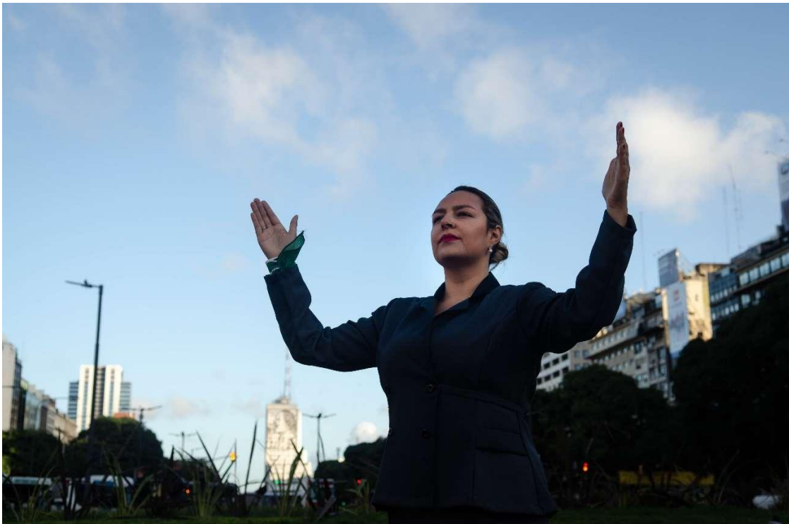
Figura N° 2. Una de las Evas posando con el pañuelo verde en su muñeca. Intervención Evita el Macrismo. Ciudad Autónoma de Buenos Aires, 6/5/2019.

feminista. De esta manera, puso en escena un cruce entre el pasado y el presente, cuyo escenario fue el cuerpo de los y las voluntarias, circulando en el espacio urbano.