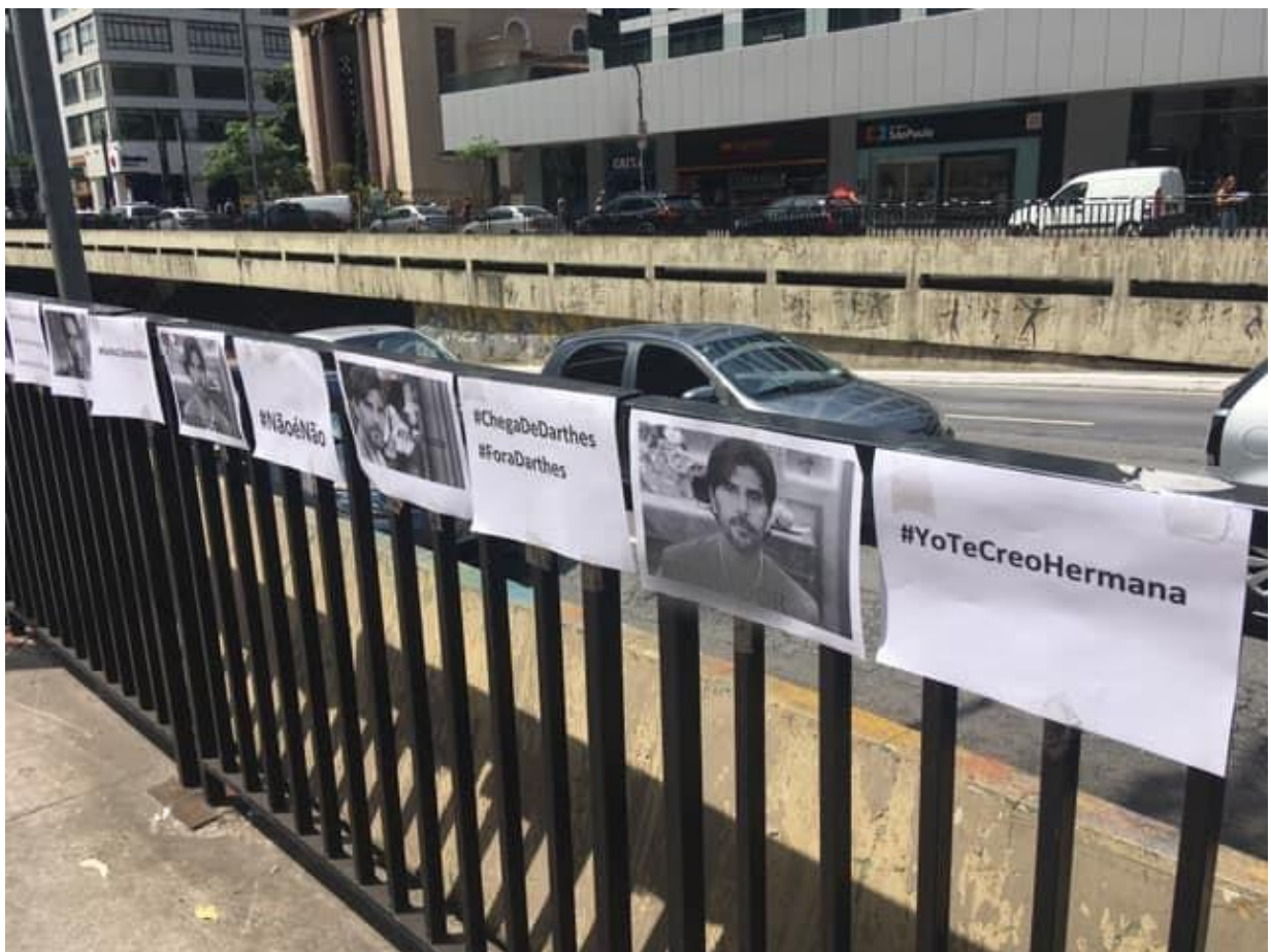
Figura N° 3. Detalle de los carteles colocados durante la acción de repudio. La imagen fue tomada el 21 de diciembre de 2018, autoría colectiva y anónima en nombre de la acción, San Pablo, Brasil.