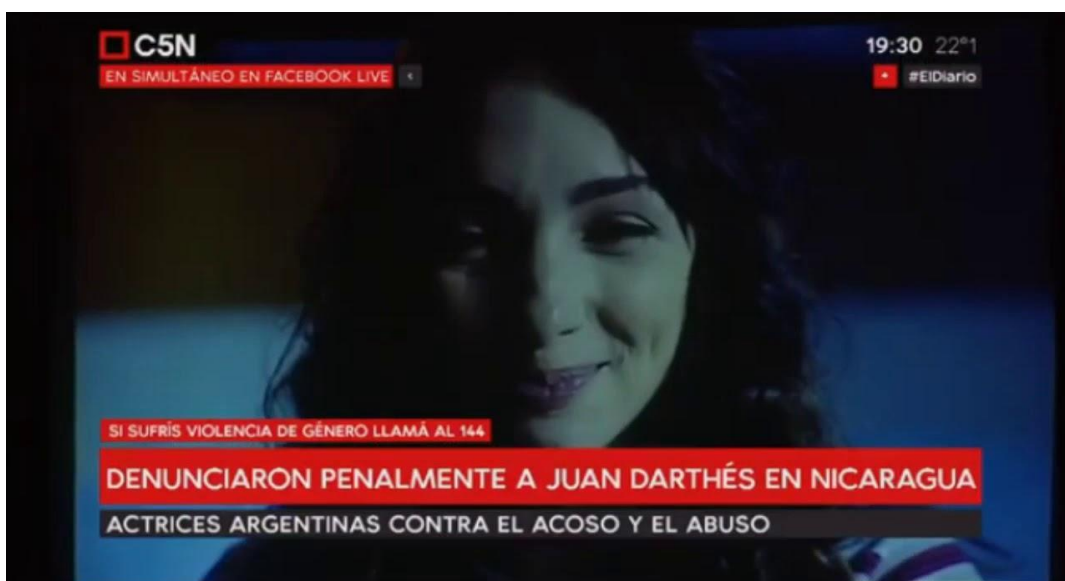
Figura N° 2. Captura de pantalla del video emitido durante la conferencia de prensa del Colectivo Actrices Argentinas, Ciudad Autónoma de Buenos Aires. Difundido por C5N en su cuenta de Youtube el 11 de diciembre de 2018.