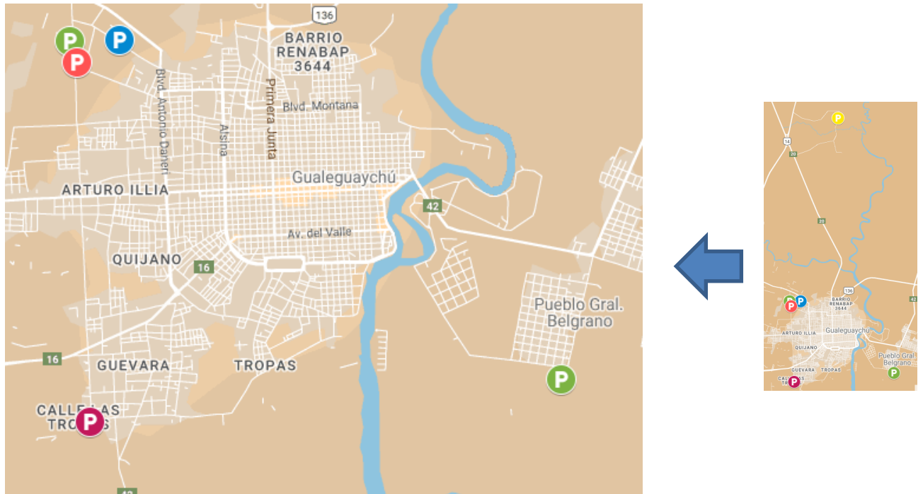
Figura 1 - Localización aproximada de los productores hortícolas entrevistados