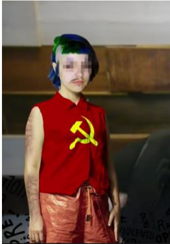
Figura 3: “Flujo”