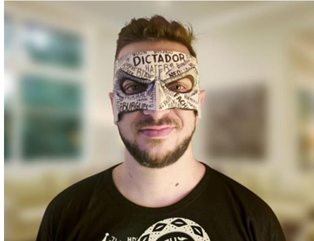
Figura 2: La Máscara de “Tipito Enojado”