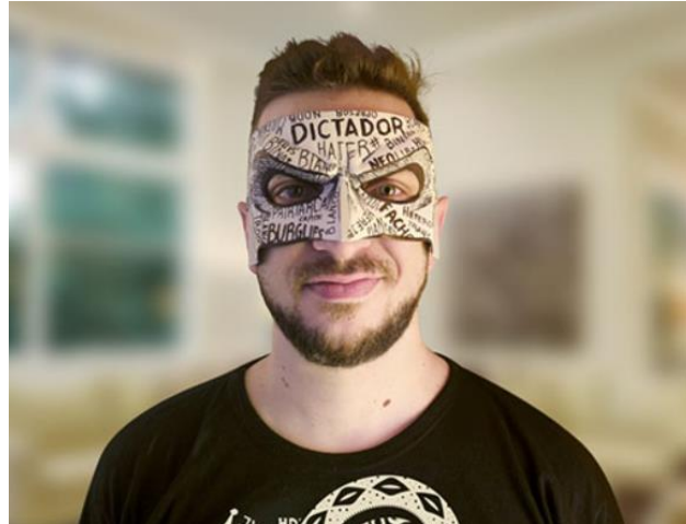
Figura 2: La Máscara de “Tipito Enojado”