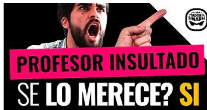
Figura 5: Thumbnail del video