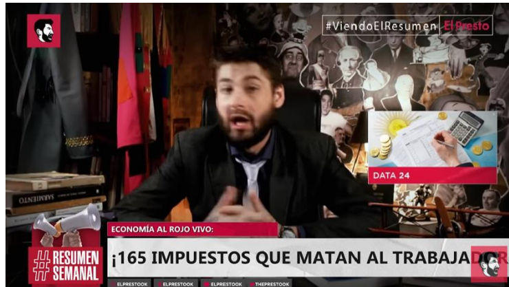
Figura 1: El Presto en su estudio

a una cámara y un graph periodístico tradicional (Figura 1) en el que presenta los temas ya sugeridos por el título del video.