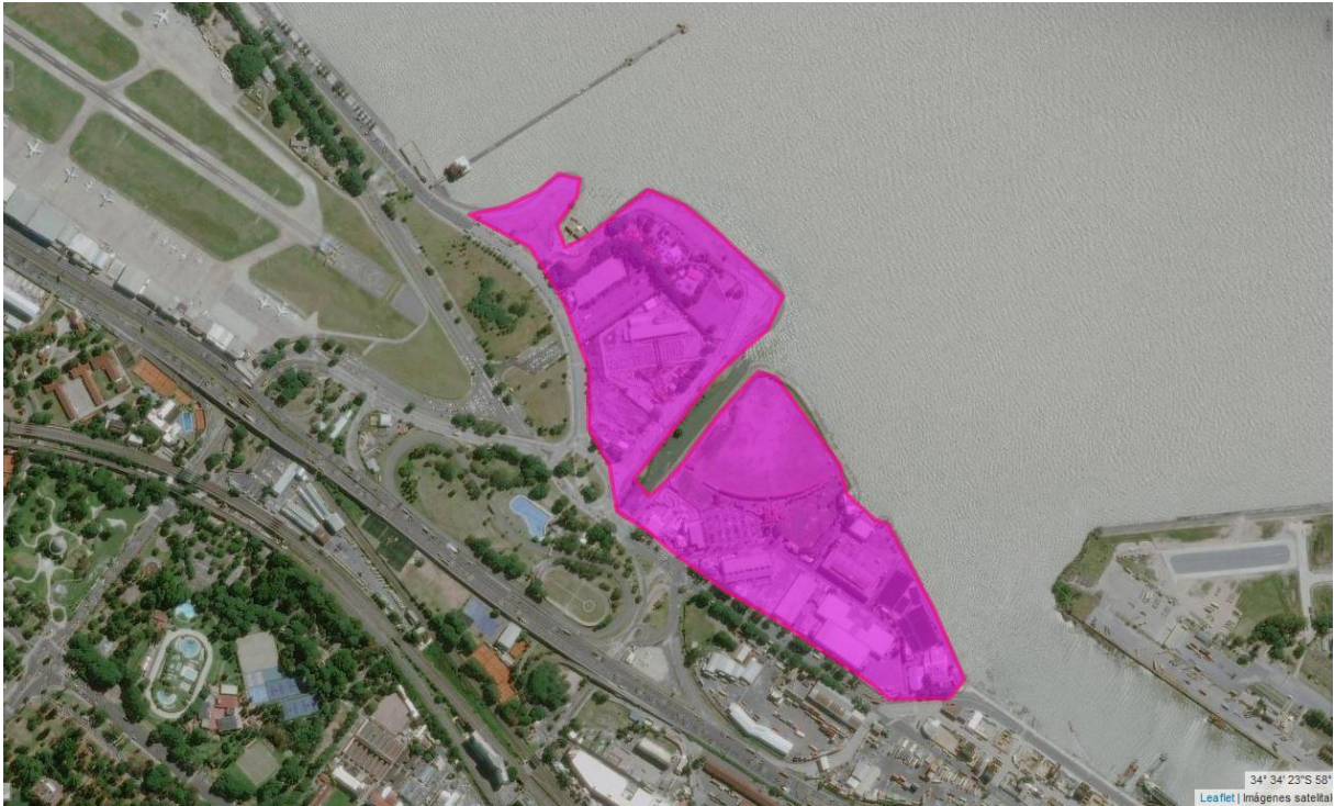
Imagen 3. Superficie de los predios de Costa Salguero y Punta Carrasco, Ciudad de Buenos Aires.