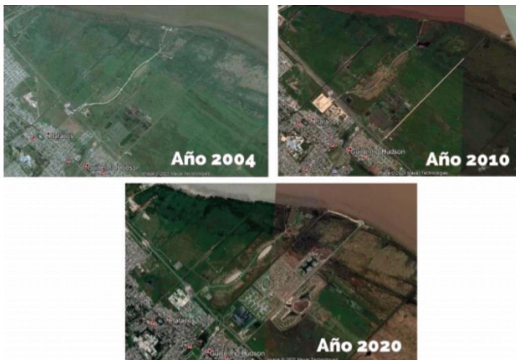
Figura V: Cambios en el área ribereña de Hudson, partido de Berazategui.