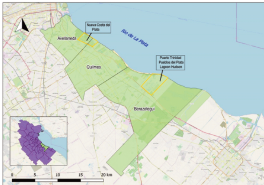
Figura I: Partidos de Avellaneda, Quilmes y Berazategui en el contexto metropolitano, y emprendimientos residenciales.