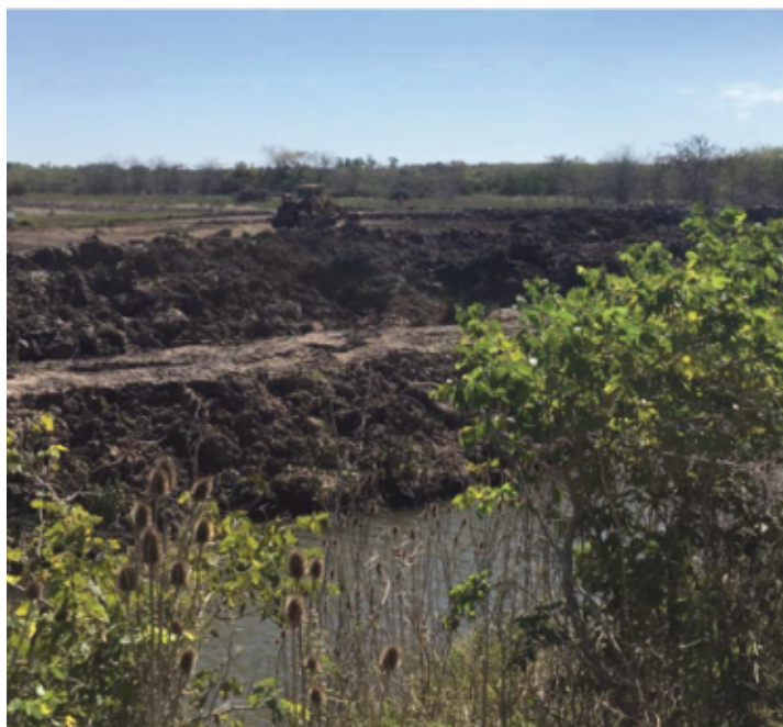
Figura IV: Relleno del humedal para la construcción de terraplenes, produciendo su sequedad.

Fuente: Fotografía tomada en recorrido de campo. Humedales de Hudson (Pdo. de Berazategui), en el año 2017, previo a la construcción del megaemprendimiento urbano Pueblos del Plata.