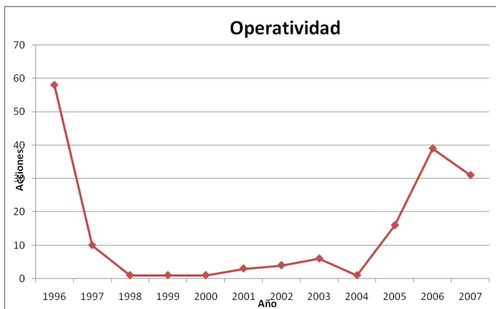
Gráfico I. Operatividad del EPR de 1996 a 2007